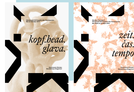
Katalogi Trienneale I, 2017 (levo) in II 2020 (desno)

Sodelujoči društvu predložijo besedilni ter slikovni material namenjen dokumentaciji in publikaciji. Sodelovanje je prostovoljno, izključno z avtorskimi projekti. Društvo umetnikov Koroške ne nudi finančne ali organizacijske podpore. Projekti so odgovornost posameznika/skupine.