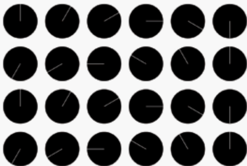
Wolfgang Grossl zeit werk 1 und 2, 2020 website, http://zeit.grossl.at

Il tema schok.šok.shock dal soggetto tramite il collettivo fino a uno shock globale lascia spazio ad un'innumerabile quantità di soluzioni artistiche.