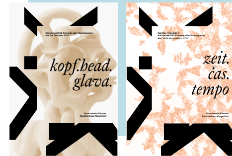
I cataloghi della Triennale I, 2017 (sx) e II 2020 (dx)

Tutti i partecipanti devono fornire gratuitamente e senza violare i diritti di terzi alla Kunstverein testi e materiale fotografico a scopo di documentazione e pubblicazione. La Kunstverein Kärnten non dà supporto finanziario o organizzativo. I singoli progetti vengono svolti sotto responsabilità degli organizzatori/delle organizzatrici.