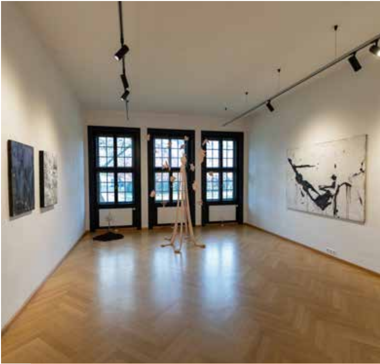
Präsentation der neuen Mitglieder in der Kleinen Galerie