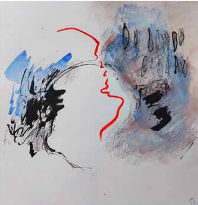
aus der Serie Janus- alter ego , 2021 Mischtechnik auf Papier, 30×30 cm

3/3–15/4/2022 Kleine Galerie Monika Kircher