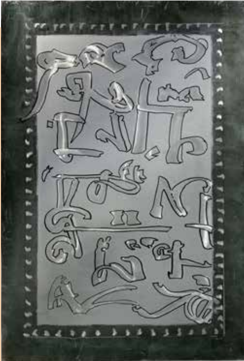
Ohne Titel , 2021 Blechtschliffbild auf beschichtetem Aluminiumblech, 68×100 cm