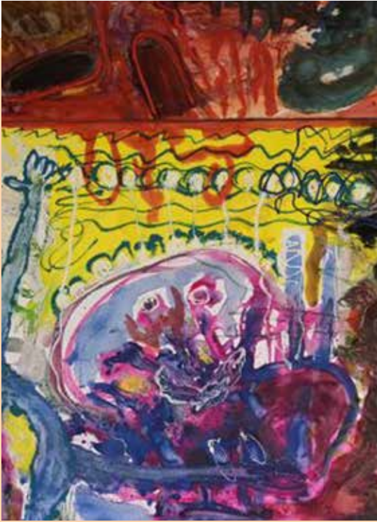
Ausschnitt, Figuren und Köpfe mit Fisch , 2021 Mischtechnik auf Karton, 160×560 cm © Rupert Wenzel

13/1–24/2/2022 Kleine Galerie Rupert Wenzel