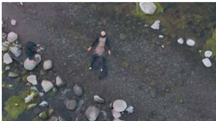
Gilivanka Kedzior All Along The Way , 2018