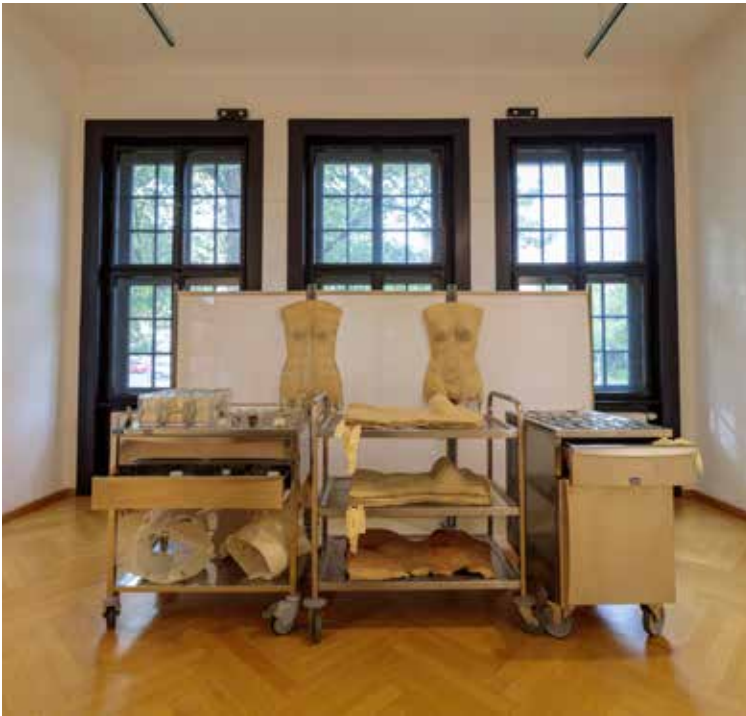
Rauminstallation von Marlies Liekfeld-Rapetti

8/9–28/10/2022 Kleine Galerie Richard Kaplenig Marlies Liekfeld-Rapetti Tina Ruisinger